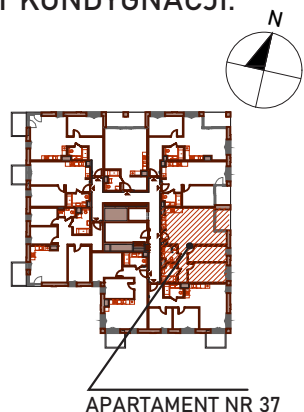
APARTAMENT NR 37